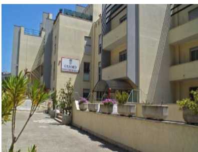
Apulia befindet sich in einer dreistöckigen Villa mit einer Gesamtfläche von ungefähr 2.000 m 2 . Die Schule verfügt über 12 Unterrichtsräume, Multimedialabor mit kostenlosem Internetzugang, Konferenzsaal und Fitnessraum.