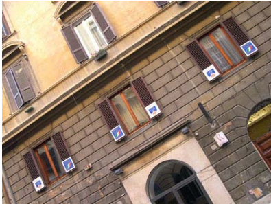
Domus Aurea befindet sich im ersten Stock eines Gebäudes aus dem 19. Jahrhundert. Die Schule verfügt über 6 Unterrichtsräume, ein Multimedialabor mit kostenlosem Internetzugang und eine kleine Terrasse.