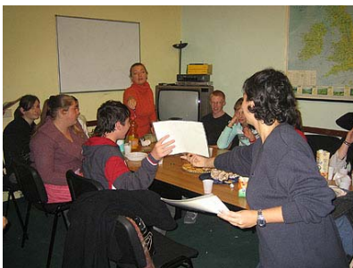
Alle Unterrichtsräume sind mit Audio-Video-Systemen ausgestattet und für eine Klassengröße von maximal 10 Studenten konzipiert.

Ein Abschlusstest vervollständigt die Beurteilung der Studenten, die zu Kursende eine Teilnahmebestätigung über den Besuch ihres vom italienischen Bildungsministerium anerkannten Kurses erhalten.